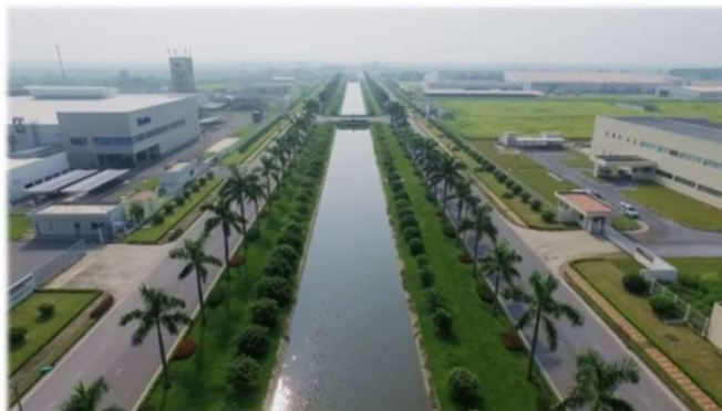
日経・第三タンロン工業団地(VINH PHUC省)