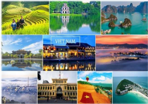
ベトナム・有名な観光地